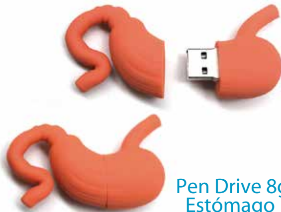
Pen Drive 8g Estómago