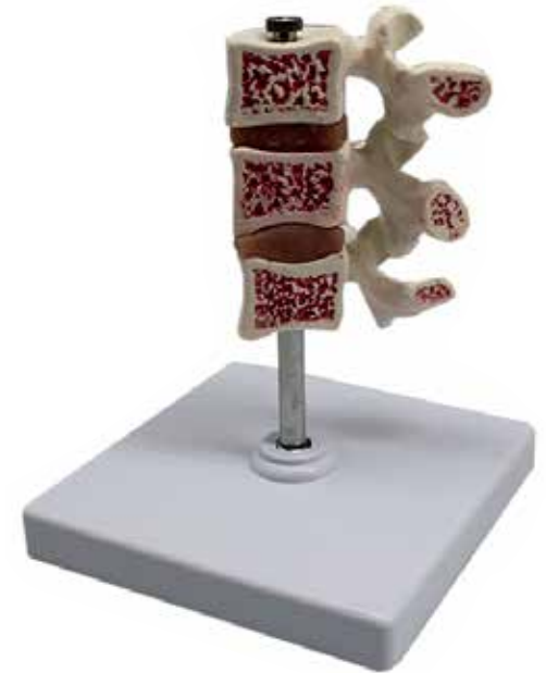
Figura Anatómica Vértebras CÓDIGO: AM026