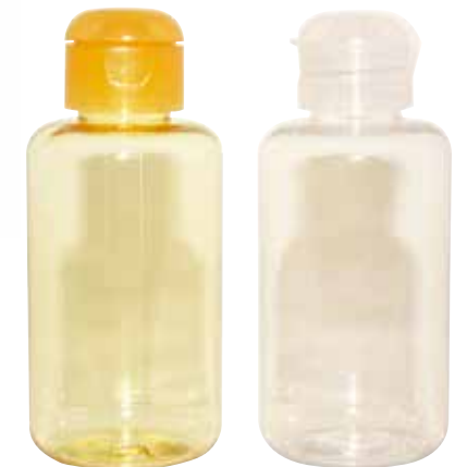
Envase de gel con tapa 120ml