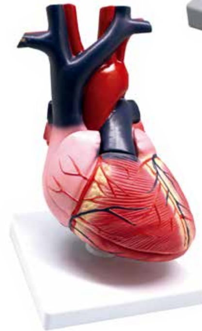
Figura Anatómica Corazón CÓDIGO: AM025