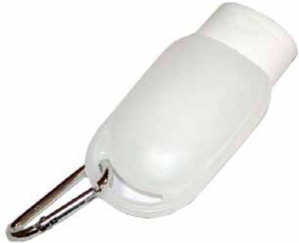
Envase con arnez

IMAGINATION DONDE LA IMAGINACION SE HACE REALIDAD