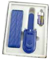
Linterna con Bajalengua