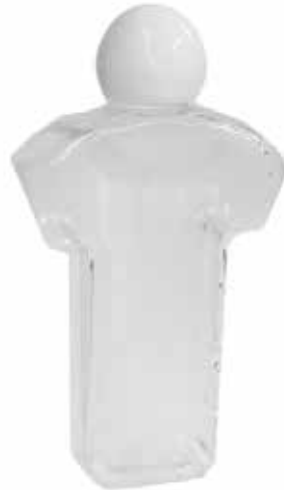
Envase gel 80ml CÓDIGO: B860B