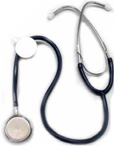
Porta identificador Estetoscopio blanco CÓDIGO: CF05