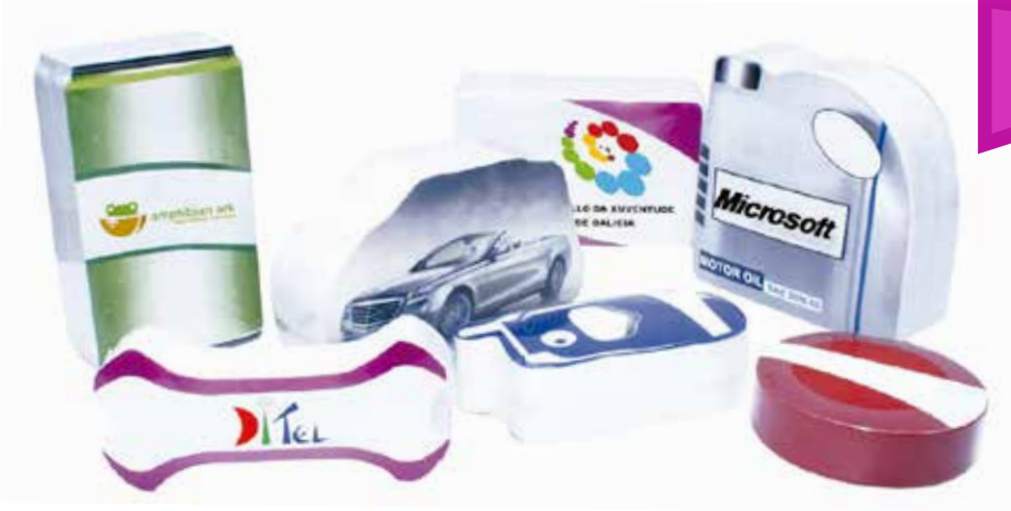
Toallas y Camistas Compactadas

IMAGINATION DONDE LA IMAGINACION SE HACE REALIDAD