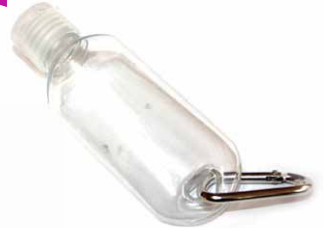
Envase con arnez