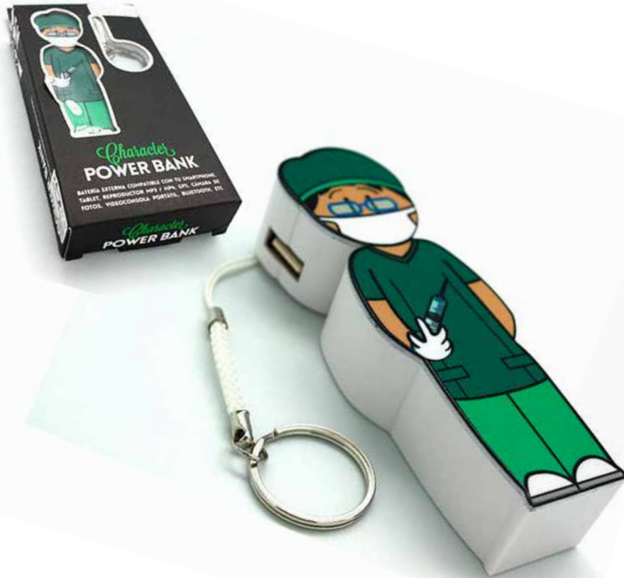
Power bank Cirujano CÓDIGO: PW2004

IMAGINATION DONDE LA IMAGINACION SE HACE REALIDAD