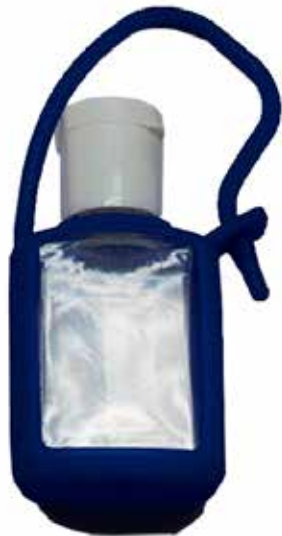
Envase con gel silicona 20ml