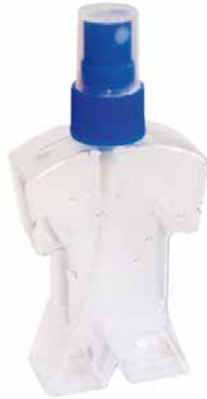
Envase gel 80ml CÓDIGO: B975S