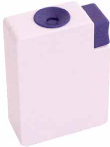
Contenedor de agujas CÓDIGO: S17810