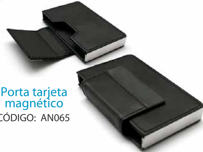
Porta tarjeta magnético CÓDIGO: AN065