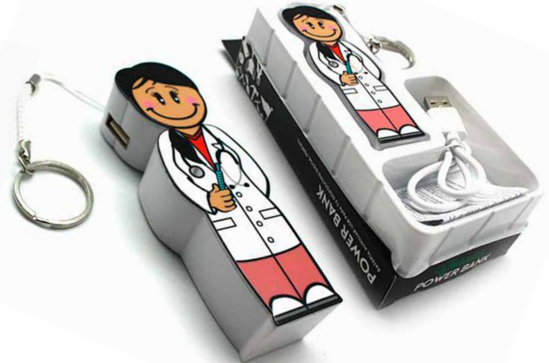
Power bank doctora CÓDIGO: PW2006