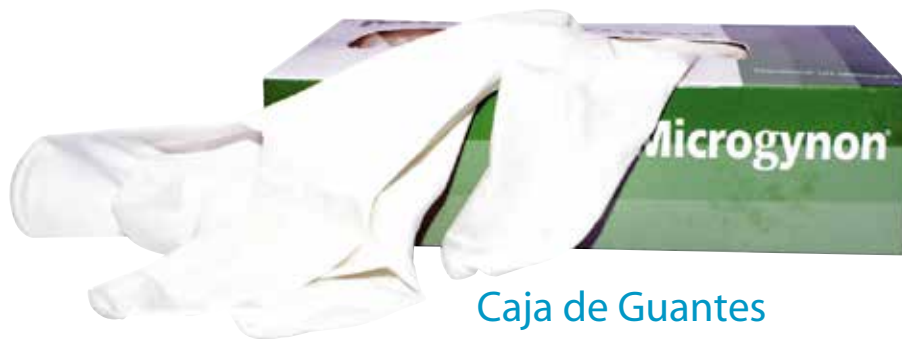
Caja de Guantes