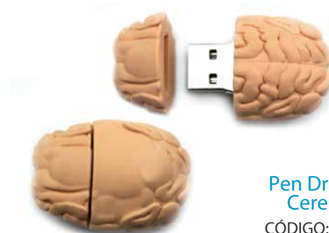
Pen Drive 8g Cerebro