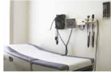
Protectores y Pies de Camilla