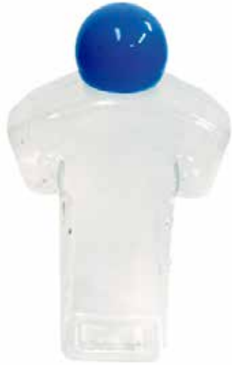
Envase gel 80ml CÓDIGO: B860A

IMAGINATION DONDE LA IMAGINACION SE HACE REALIDAD