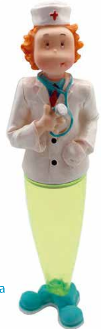
Caramelera doctora CÓDIGO: YT0030