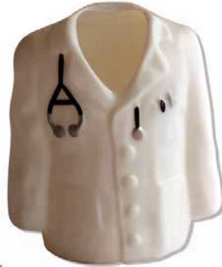
Porta esferos CÓDIGO: S12049