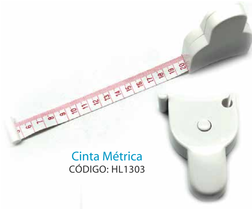
Cinta Métrica CÓDIGO: HL1303