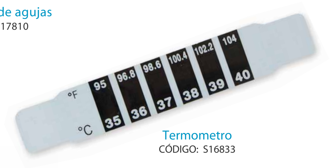
Termometro CÓDIGO: S16833