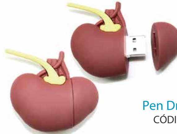
Pen Drive 8g Riñón