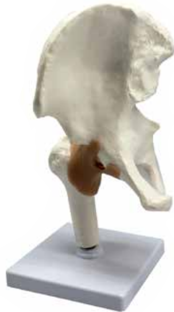
Figura Anatómica Pelvis CÓDIGO: AM013