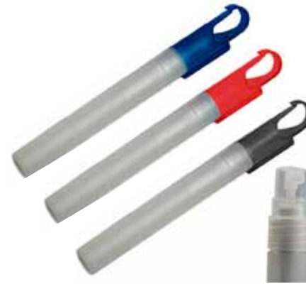
Envase atomizador llavero CÓDIGO: 6726D