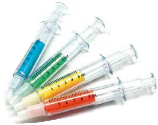
Resaltador Inyección CÓDIGO: FJHL006V