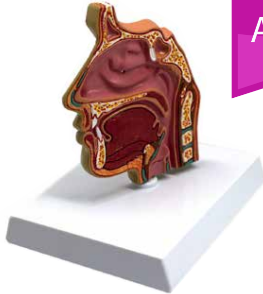
Figura Anatómica Senos Paranasales CÓDIGO: AM003