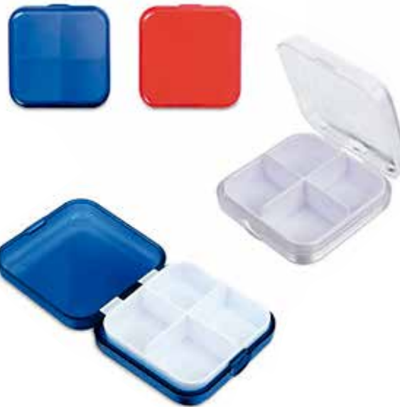
Pastillero CÓDIGO: 31137R