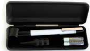
Linterna otorrino CÓDIGO: CR898