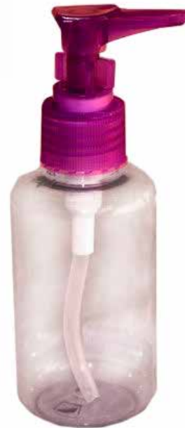
Envase gel dispensador 120ml