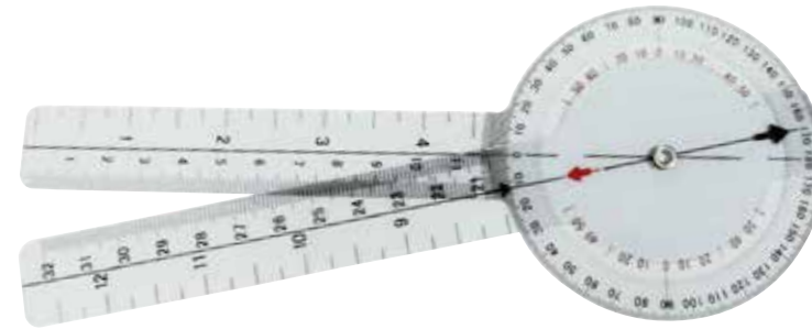
Goniómetro CÓDIGO: 8714A