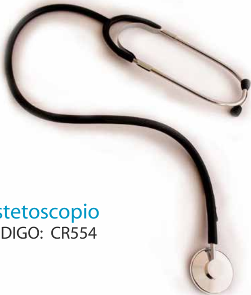
Estetoscopio CÓDIGO: CR554