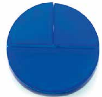
Pastillero Redondo CÓDIGO: 2171A