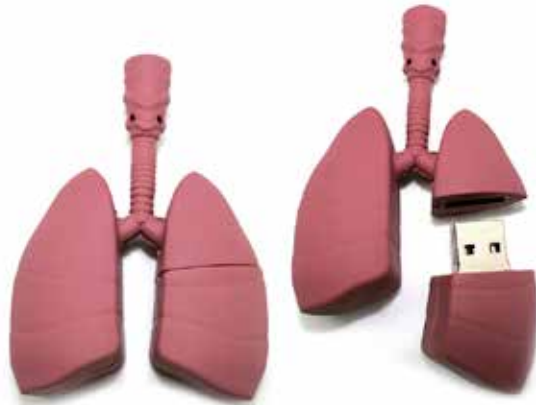
Pen Drive 8g Pulmón

IMAGINATION DONDE LA IMAGINACION SE HACE REALIDAD