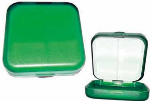
Pastillero CÓDIGO: 31137V