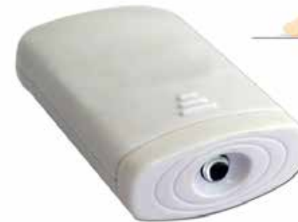
Linterna baja lengua CÓDIGO: KTGF13