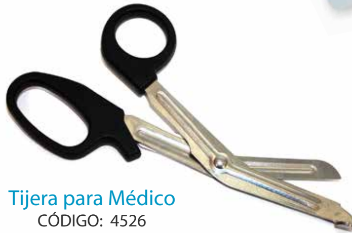
Tijera para Médico CÓDIGO: 4526