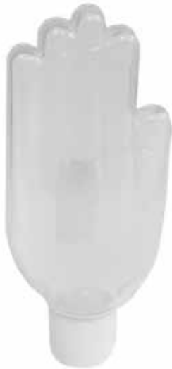
Envase gel 80ml CÓDIGO: B1075F