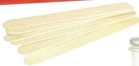
Bajalenguas en caja