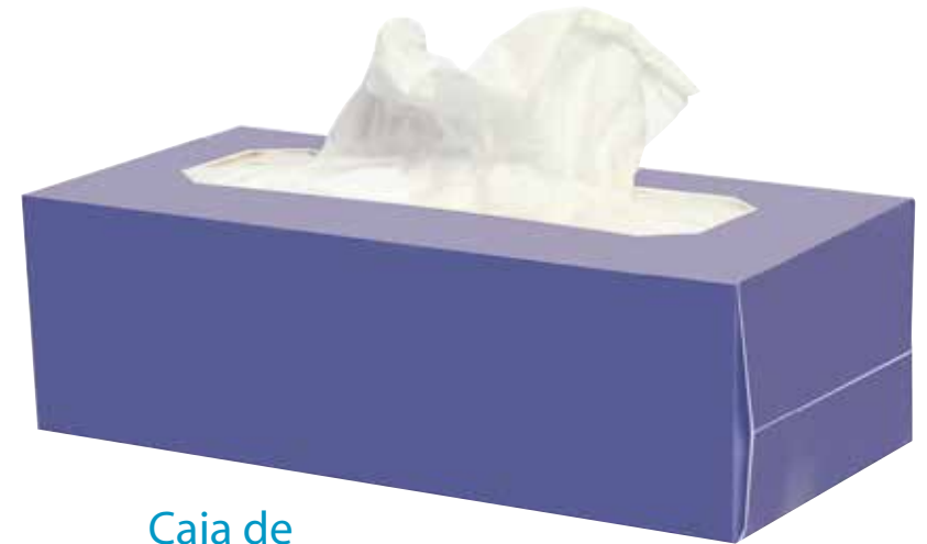
Caja de Pañuelos