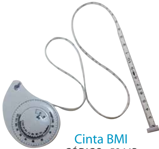
Cinta BMI CÓDIGO: 5244B

IMAGINATION DONDE LA IMAGINACION SE HACE REALIDAD