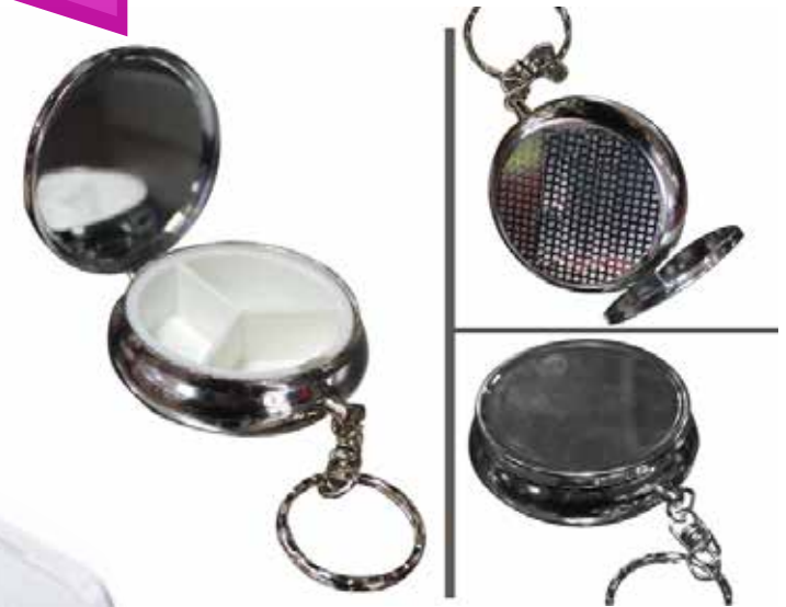
Pastillero Llavero CÓDIGO: CR1769