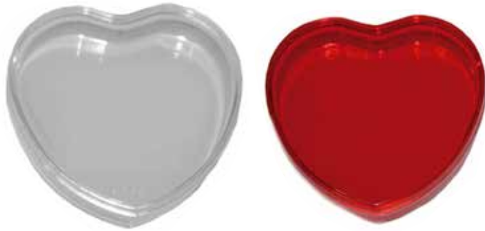
Pastillero Corazón CÓDIGO: 0164

IMAGINATION DONDE LA IMAGINACION SE HACE REALIDAD