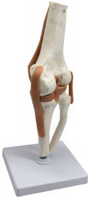
Figura Anatómica Rodilla CÓDIGO: AM009

IMAGINATION DONDE LA IMAGINACION SE HACE REALIDAD